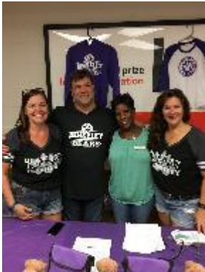
La venta de camisetas

Click for a full list of 2017-2018 volunteer opportunities – with contacts!