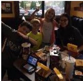
Algunos estudiantes disfrutando de una noche del PTA en el restaurante Zaxby's

Preguntas? Comentarios? Contáctenos al correo: infoblespta@gmail.com .